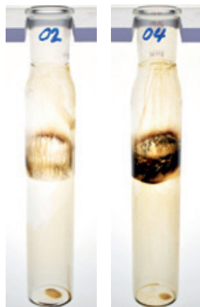
TRAXON SYNTHETIC MTF 75W-80 КОНКУРЕНТ А, СИНТЕТИЧЕСКОЕ МАСЛО, 75W-80

В испытании DKA на окисление эффективность продукта оценивалась путем измерения повышения вязкости масла в течение определенного времени (чем ниже столбик после 192 часов, тем лучше). По сравнению с двумя ведущими конкурентами продвинутой состав масла TRAXON Synthetic MTF 75W-80 лучше препятствует разложению и загустеванию масла.